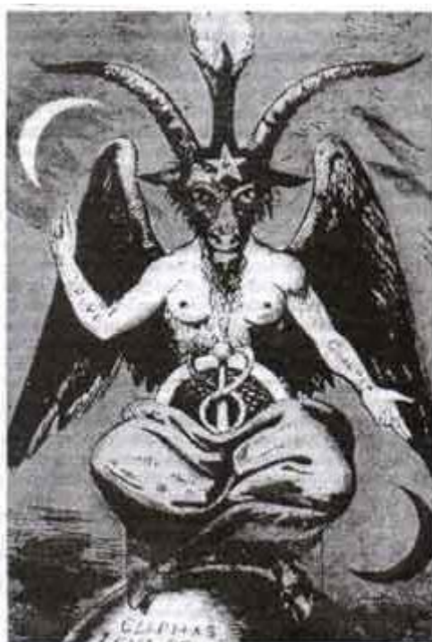
Gambar 5: Dewa Baphomet

Nama God (Tuhan) seringkali diasosiasikan dengan nama goat (kambing) yang sekaligus dijadikan sebagai lambang penyembahan atau berhala. Atau merepresentasi-kan scape goatism (teori mencari kambing hitam), sesuai dengan teori konspirasi dalam gerakan rahasia mereka.